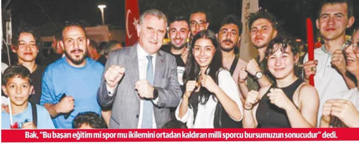
Bak, "Bu başarı eğitim mi spor mu ikilemini ortadan kaldıran milli sporcu bursumuzun sonucudur" dedi.